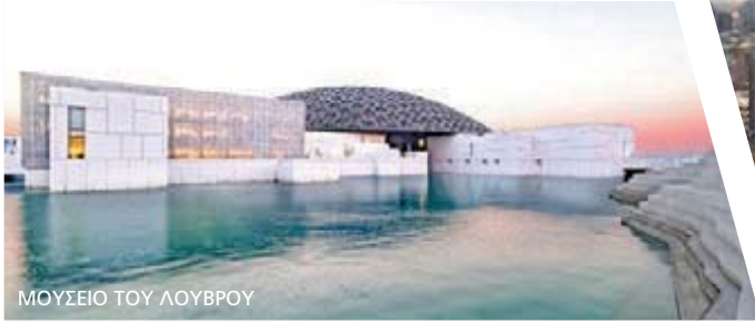
ΜΟΥΣΕΙΟ ΤΟΥ ΛΟΥΒΡΟΥ